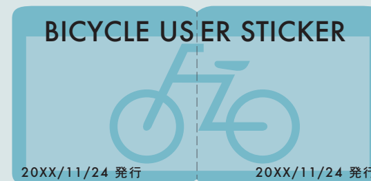
BU シール デザイン案

市が推進してきた自転車施策の一つである「一般の自転車利用者の自転車保険の加入の義務化」と併用し、希望者は保険加入と同時に自転車購入時に添付します。また、盗難や悪用防止のため登録時の個人情報 は自転車保険と同時に市が管理します。