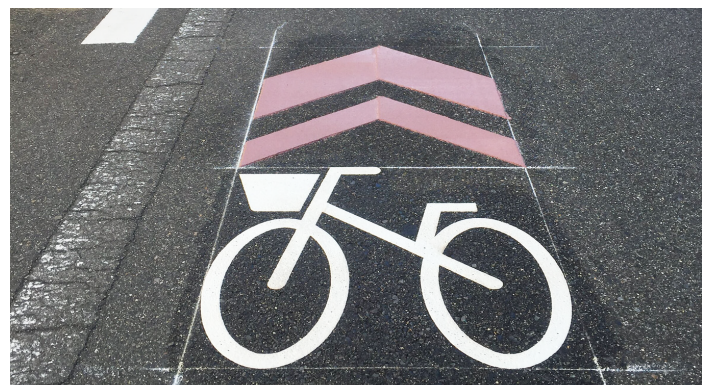
自転車走行推奨帯

そもそも「自転車共存都市」として本来あるべき姿とは、デメリットを大きくして半ば脅すような形で強制させるものではないのです。