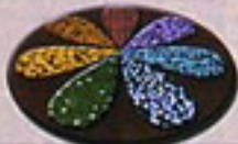
レインボーフラワー花壇

校庭や公園、遊園地などの身近な場所にレインボーフラワーの花壇をつくり、それぞれの色の意味を知ることによって世界の健康状態を知り平和に関心をもってもらおう。