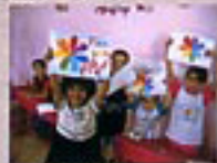
世界の子どもに「レインボーフラワー」塗り絵

小さな子どもの頃から、世界の問題に関心を持ってもらえるようにレインボーフラワーの塗り絵をしてもらい、塗り絵をいろいろな場所で展示して大人にも関心を持ってもらう。