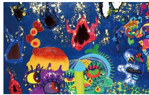
カズリ D 6F KAZURI