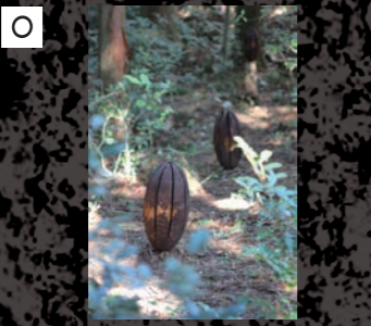
ギャラリー志門 木下琢朗 / Kishita Takurou 「刀耕火種」 / 2017 / 檜、柿渋、切株