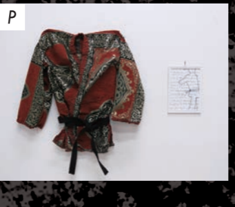
襦画廊 渋谷剛史 / Shibuya Takefumi 「柔道篇 (ジャポニズムを考察する。)」 2017 / イスラム教の礼拝布、黒帯、糸