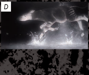
Gallery K 阿久津真那 / Akutsu Mana 「瞬」 / 2017 / 和紙、岩絵具、水干、 銀泥、胡粉、墨