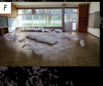
藍画廊 吉岡朝美 / Yoshioka Tomomi 「たれにも知られないように」 / 2017 / 紙、糸