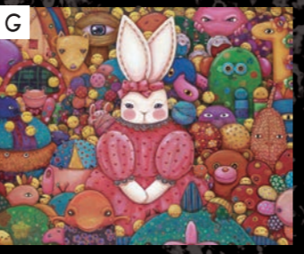
GALERIE SOL 藤沢深花 / Fujisawa Miika 「Age of Toy's」 / 2015 / アクリル、 キャンパス