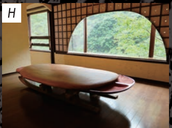
K's Gallery 外丸治 / Tomaru Osamu 「露の下で」 / 2015 / 木、縄、銀箔、 亜麻仁油、顔料、膠