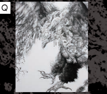
十一月画廊 遠藤満希 / Endo Maki 「飛翔」 / 2016 / ミュウグラント、 綿布、鉛筆、墨