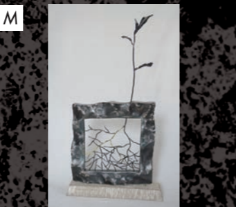
ギャラリー・ブス さききりえ / Sasaki Rie 「地面の上 地面の下」 / 2017 / 鉄・金箔