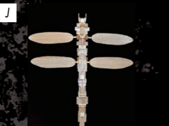
ゆう画廊 戎丸ゼノ / Inumaru Xeno 「Inumaru's HEBIKERA」 2017 / バルサ材