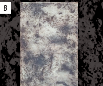
ギャラリー 檜 C 尾留川優子 / Birukawa Yuko 「磁戯」 / 2016 / 油性木版