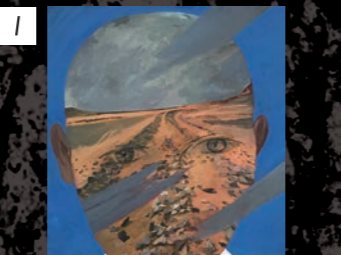
ギャラリー Q 中田朝乃 / Nakada Asano 「覚悟」 / 2017 年 / アクリル絵具