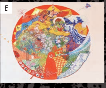
ぎやらりい 朋 新井涼香 / Arai Suzuka 「Cool Japan III」 / 2017 / 岩絵具、 水干絵具、色鉛筆、他