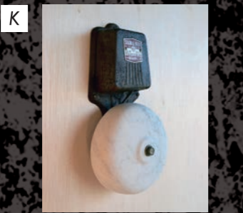
Steps Gallery 村松英俊 / Muramatsu Hidetoshi 「Bell」 / 2017 / 石彫・ベル、大理石