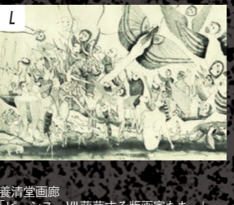
養清堂画廊 「ピュシス - VII 萌芽する版画家たち -」