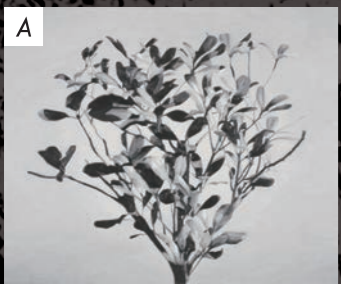
ギャラリー 檜 F 吉田一民 / Yoshida Kazutami 「THE TOP OF A TREE」 / 2017 / 油彩