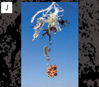
ゆう画廊 マナトマリ / Manatomari 「パイナップルスポット」 / 2017 スタイロフォーム、布、ビニール