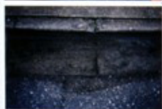
水たまりができた道路

従来の道路では、雨が降ってきた時に、大きな水たまりができてしまいます。そこへ車が走ると水しぶきが上がり、歩行者がいやな思いをすることがあります。冬になると水たまりが凍って非常に危険です。雪が降ると溶けた雪がまた水たまりになって、もっと水しぶきが大きくなります。